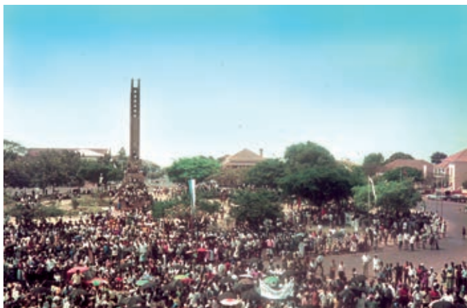
diapguiné20 Comemorações de apoio a Portugal