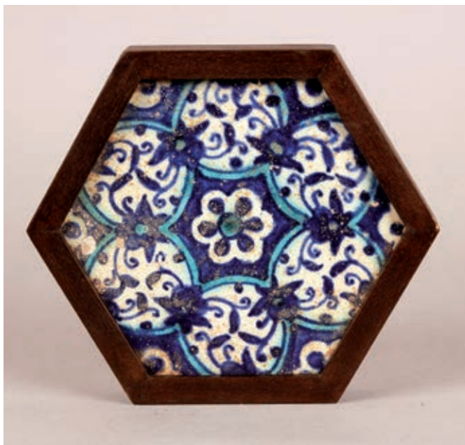
Fig. 3 – Azulejo (Índia)