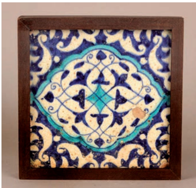
Fig. 2 – Azulejo (Índia)