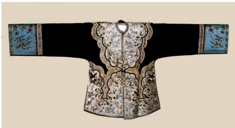
Fig. 10 – Peça de vestuário (China)