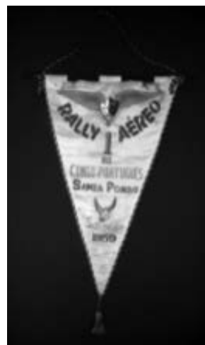
Galhardete do 1º Rally Aéreo do Congo Português, realizado em Sanza Pombo, setembro 1959.

Foi sepultado no cemitério da Vila de Sanza Pombo, em jazigo pago por subscrição pública, pelo