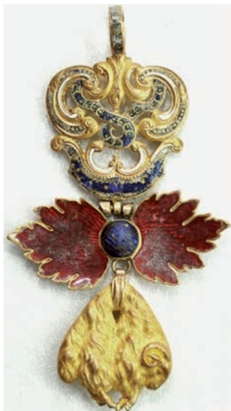
Insígnias da Ordem do Tosão de Ouro À esq. - Insígnia recuperada da urna funerária de D. Pedro Ouro com esmaltes, dim. 117 x 64 mm. Peso 94,4 g Fabrico português