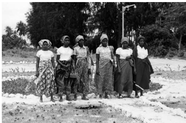
Fig.1- Mulheres de quimão e capulana, da I. Ibo. 1971

O mucume é uma capulana grande: conjunto de 6 lenços posta das ancas até em baixo, medindo, cerca de 2,10mx2,10.