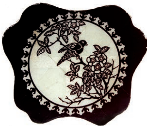
Fig. 9 – Vidro de janela (China)