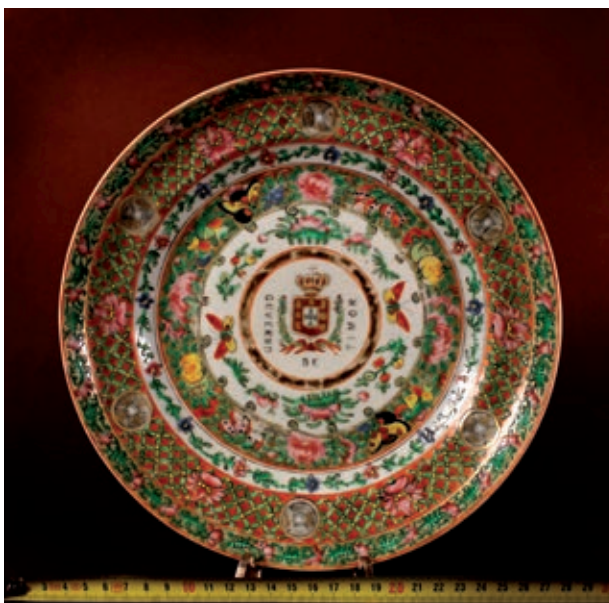
Fig. 5 – Prato com brasão do Governo de Timor