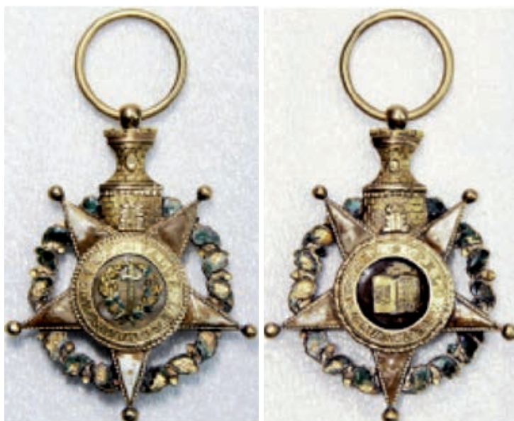
Pendente da banda da Grã-Cruz da nova Ordem da Torre e Espada, exumada da urna de D. Pedro. Prata esmaltada e dourada. Dia. 39 mm; h. 65 mm; esp. 6,2 mm. Peso 19,7 g. Torre com ameia direita. Fabrico inglês sem marcas (Londres, 1832-33).