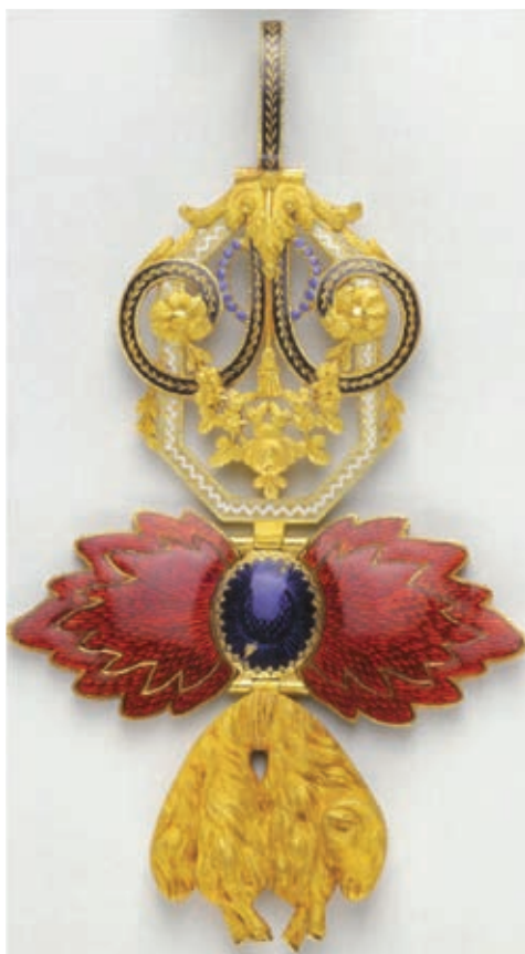
À dir. - Insígnia de D. João VI na colecção Spada Ouro com esmaltes, dim. 130 x 71 mm. Peso 98 g Fabrico português