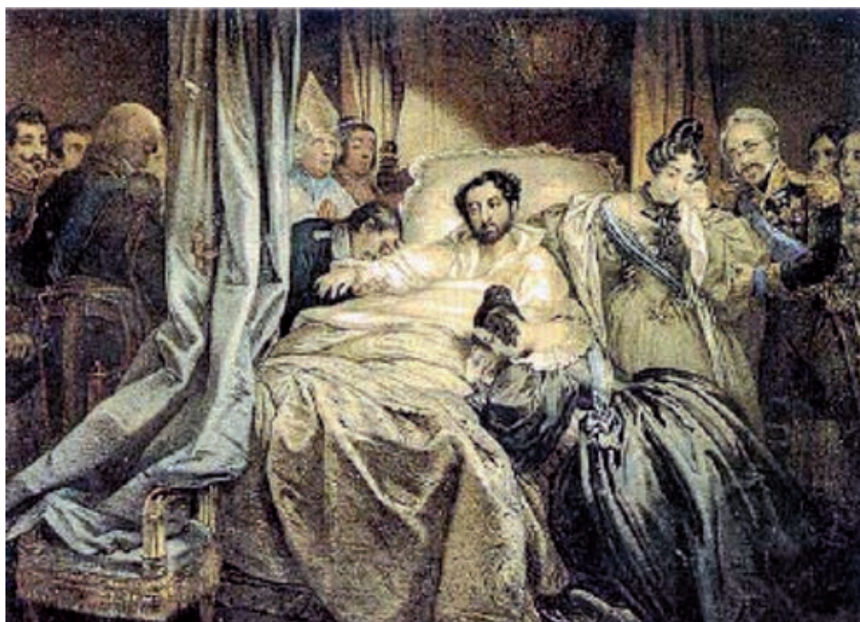
Nicolas-Eustache Maurin, A morte de D. Pedro, gravura colorida à mão, Paris, 1834.

Desenho de grande realismo, onde se podem observar, do lado direito, o duque de Saldanha, a rainha D. Maria II com a sua banda das Três Ordens, e a imperatriz Dona Amélia.