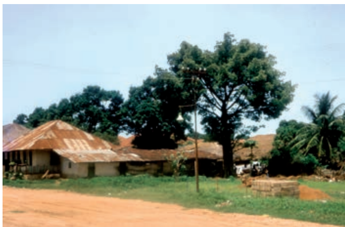
diapguiné13 Zona velha de Bissau