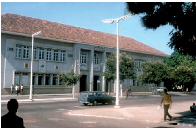
diapguiné11 Edifício dos CTT