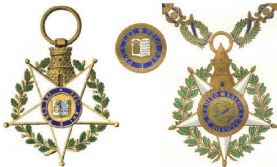
Desenhos de pendentes da banda de Grã-Cruz e do colar da Ordem Militar da Torre e Espada, do Valor, Lealdade e Mérito: à dir. - publicados em Lisboa em 1881 (Silva e Tavano): a argola de suspensão agarra no telhado cónico da torre. à esq. - publicados na Alemanha em 1870 (Schulze, suplemento): a argola de suspensão agarra num barrilete colocado sobre a ameia da torre.