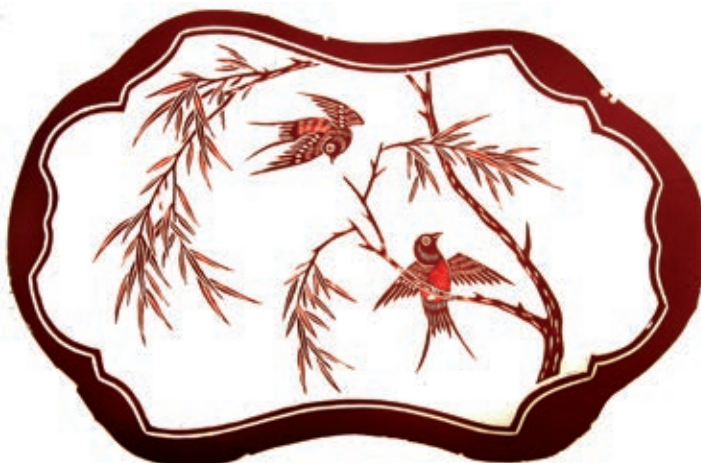
Fig. 7 – Vidro de janela (China)