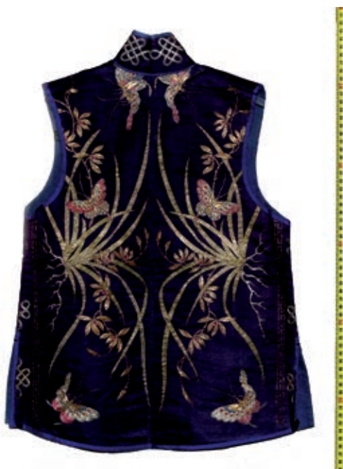
Fig. 11 – Colete (China)