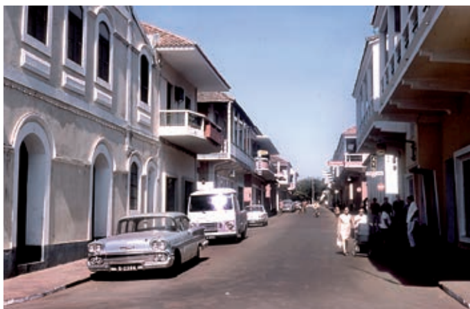
diapguine32 Uma rua em Bissau