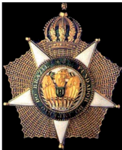
A Ordem de D. Pedro I, Fundador do Império do Brasil (1826), serviu de modelo para o desenho das insígnias da nova Ordem Militar da Torre e Espada, do Valor, Lealdade e Mérito, instituída pelo mesmo D. Pedro no Porto, como regente em nome de D. Maria II (1832)

Desenho de grande realismo, onde se podem observar, do lado direito, o duque de Saldanha, a rainha D. Maria II com a sua banda das Três Ordens, e a imperatriz Dona Amélia.