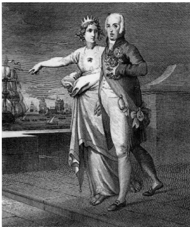
D. A. de Sequeira L'Port. da Cam. de S. M. Fid. inv.