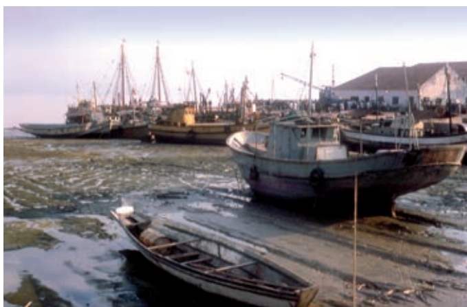
diapguiné36 Porto de Pidjiquitii