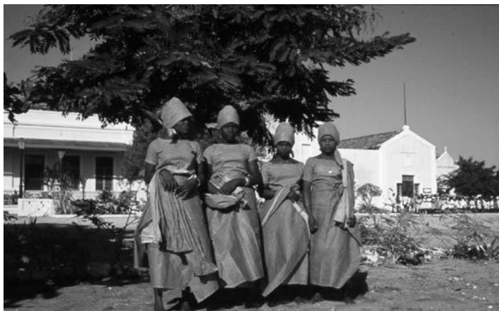
Fig.2- Mulheres de quimão e capulana, da I. de Querimba. 1971

O quisambi é uma capulana pequena constituída por 2 lenços que serve para cobrir por cima do mucume , medindo cerca de 1,5x1,5.