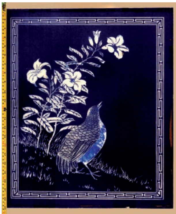
Fig. 6 – Vidro de janela (China)