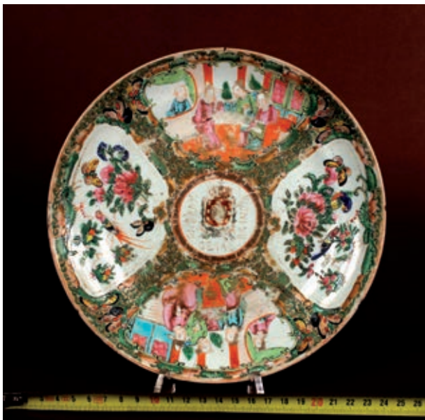
Fig. 4 – Prato com brasão do Governo-Geral da Índia