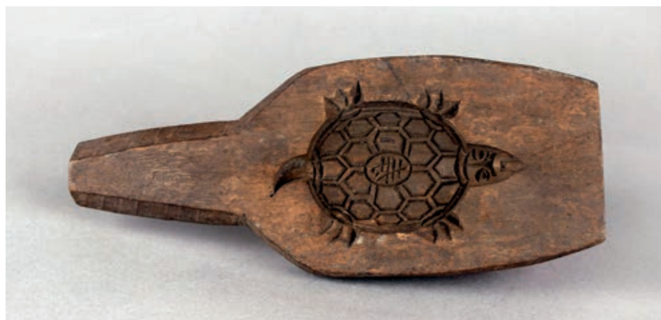
Fig. 1 – Marcador / forma de bolos (China)