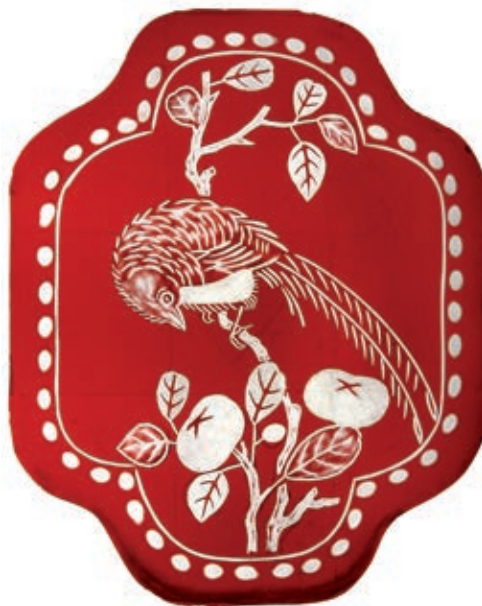
Fig. 8 – Vidro de janela (China)