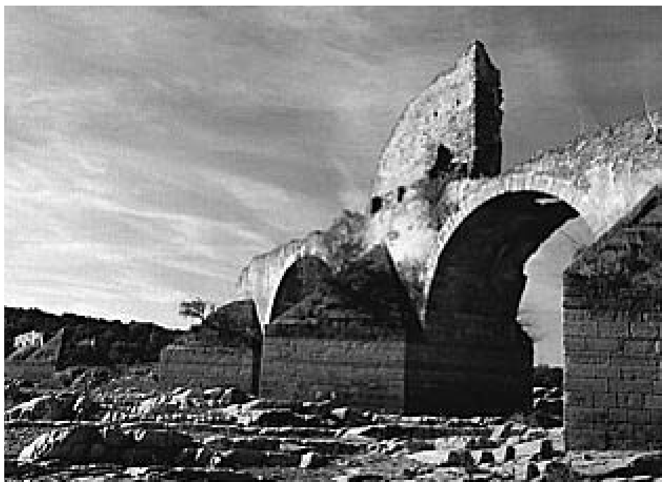
Amputada, derruída e a esboroar-se a velha ponte manuelina mantém todo o seu encanto.

Os trabalhos não prosseguiram, na sequência de decisão do Ministério do Fomento Espanhol.