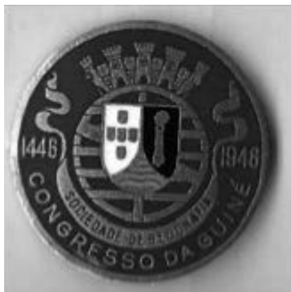
Pin do Congresso da Guiné 1946, realizado na Sociedade de Geografia de Lisboa.