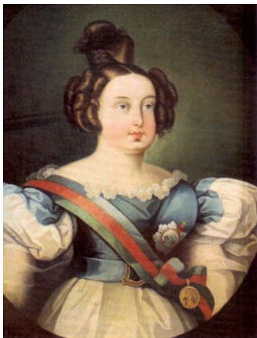
À esq. - D. Maria II, c. 1833. Com pendente da banda oval, de infante, dourada e encordoada. Anónimo, Escola inglesa.