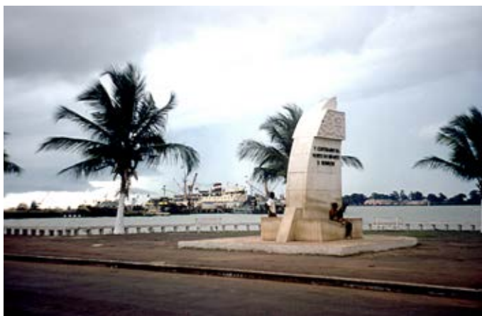
diapguiné35 Monumento comemorativo do 5º Centenário ds morte do Infante D. Henrique