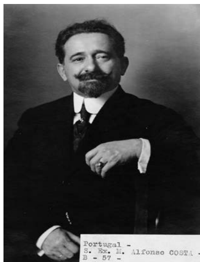
Figura 1: Afonso Costa, segundo chefe da delegação portuguesa na Conferência de Paz de Versalhes