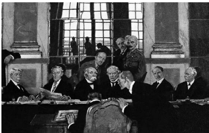
Figura 3: A Conferência de Paz de Versalhes: nesta imagem algumas das figuras proeminentes – Wilson, o segundo a contar da esquerda, logo seguido de Clemenceau, Lloyd-George e Smuts (fardado).

povos, “incapazes de se governar, para o seu pleno desenvolvimento, algumas potências, pela sua experiência e posição geográfica, deveriam exercer tutela como mandatárias em nome da Sociedade das Nações” 8 .