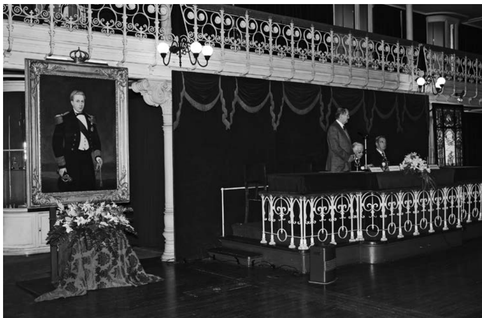
O Senhor Duque de Bragança proferindo o seu discurso