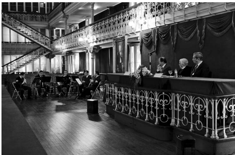
Aspecto da Sala Portugal, vendo-se o Quinteto da Marinha em actuação