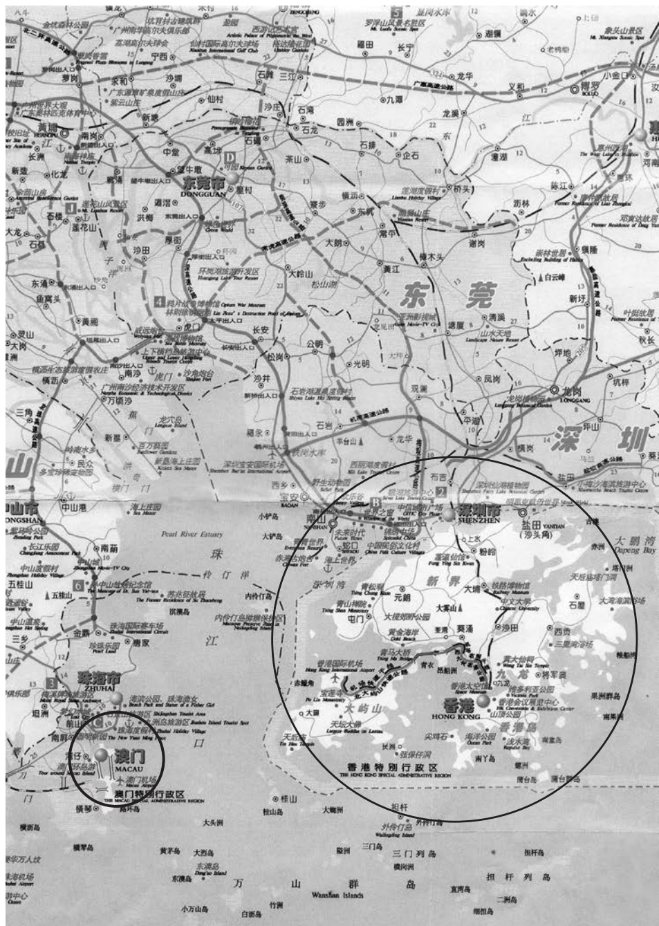
Delta do Rio das Pérolas