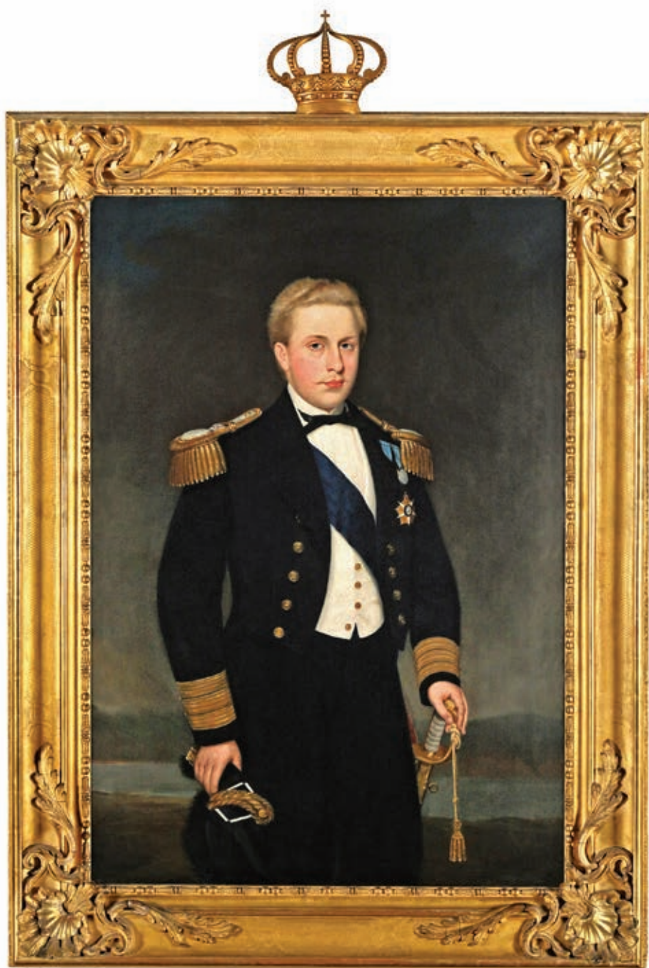
Retrato de El-Rei D. Luís, atribuído a Stewart 1864