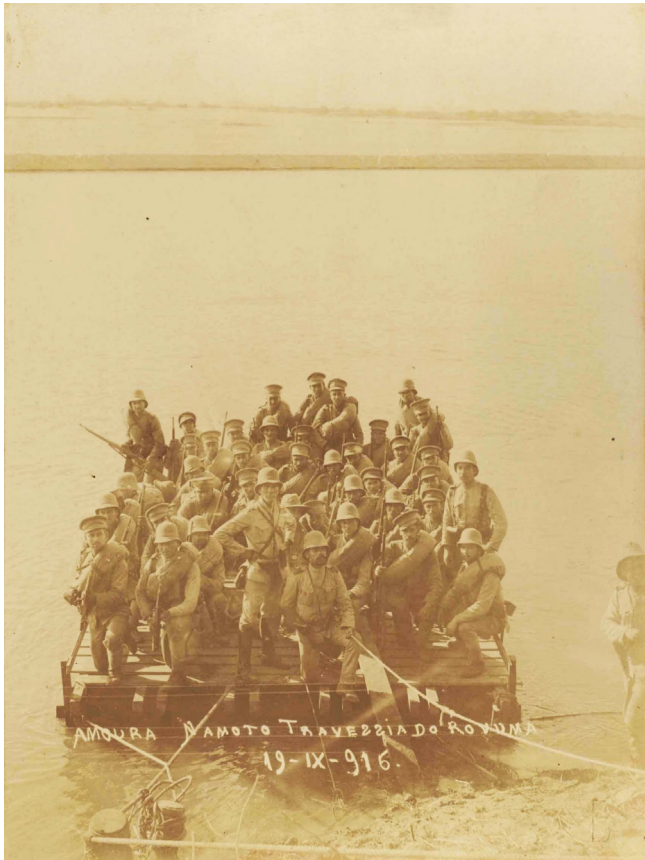
Imagem 4 - Travessia do Rovuma

A cooperação da marinha fez-se sentir pela presença do Adamastor na foz do rio, protegendo o comboio de víveres marítimo e fazendo um pequeno bombardeamento da margem alemã. Entretanto os alemães na véspera tinham evacuado aquela zona e retirado para montante, abandonando os seus postos militares.