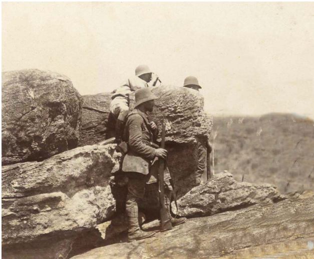
Imagem 6 – Ponto de reconhecimento e vigilância

Felizmente os indígenas daquela zona de operações foram-nos sempre favoráveis (atribuindo-se essa enorme vantagem à revolta contra os alemães em 1905) e espontaneamente nos davam informações dos movimentos alemães.