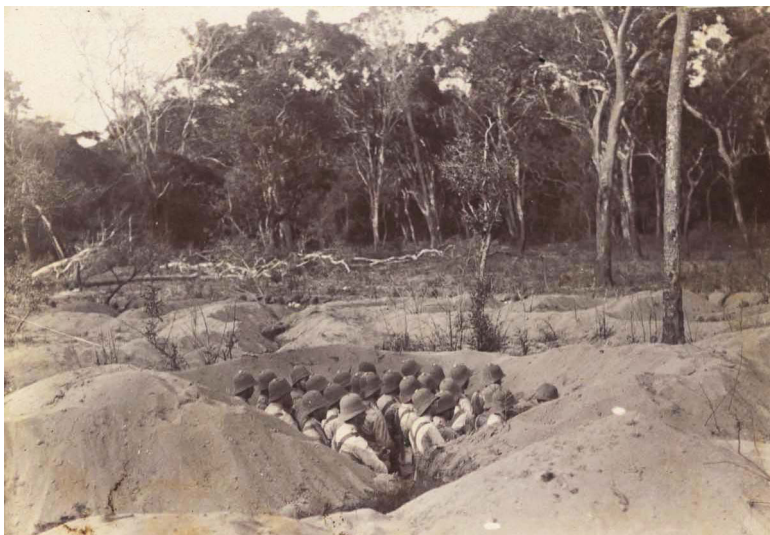
Imagem 5 – Infantaria 30 guarnecendo as trincheiras