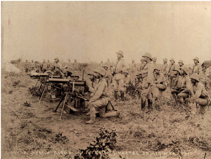
Imagem 1 – Instrução de metralhadoras em Moçambique

Pior do que o analfabetismo, dificultando a instrução militar, foi a ignorância da higiene, a falta mais prejudicial para esta e outras expedições, como se manifestou pelos desfalques observados nos efectivos, causados pelas doenças.