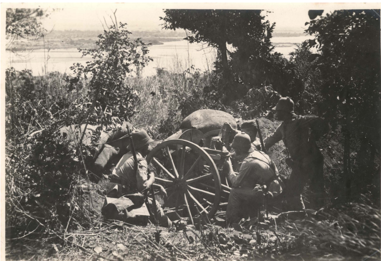
Imagem 2 – Posição de combate das forças portuguesas na margem do Rovuma