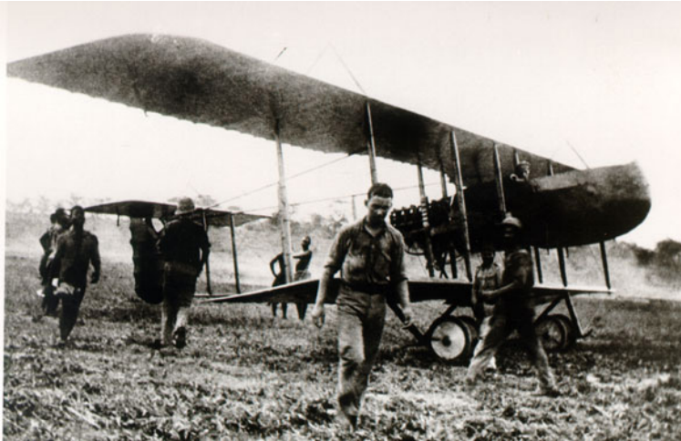
Imagem 8 – Avião Farman F-40 em Moçambique