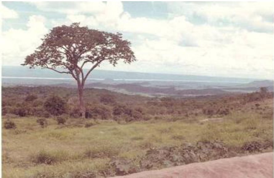
Imagem 9 - O rio Rovuma visto em Negomano na zona de confluência com o rio Lugenda